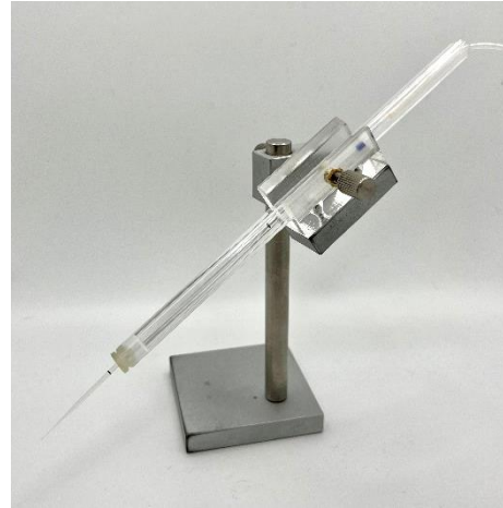
Statif pour drones