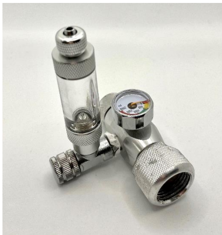
Débitmètre – détendeur de CO2