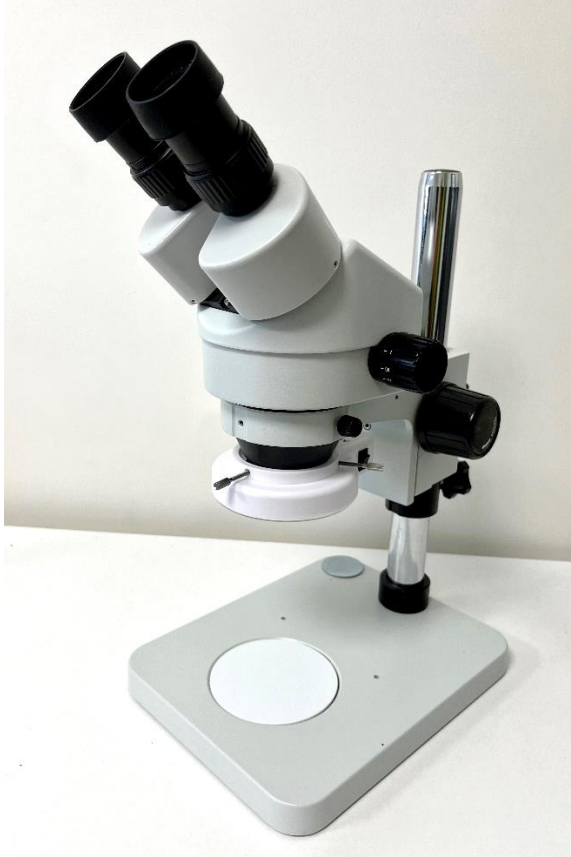
Binoculaire et LED