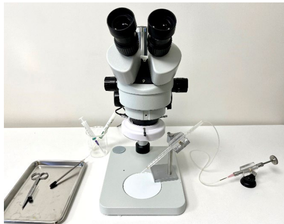
Matériel monté pour le prélèvement de semence – avec pompe déportée et statif pour drones