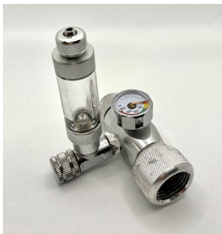
Débitmètre – détendeur de CO2 (présent dans chacun des Packs)