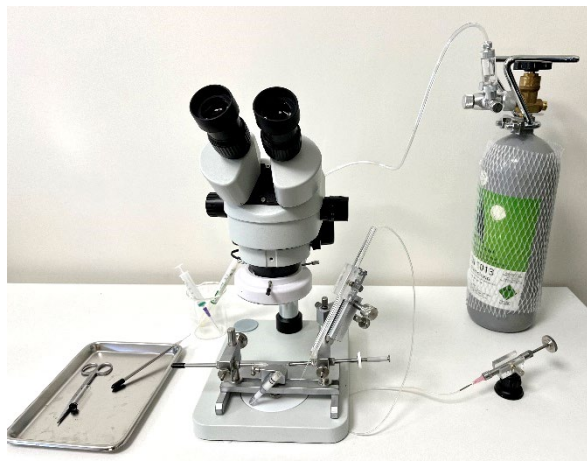
Matériel monté pour l'insémination – avec pompe déportée (bouteille de CO2 non fournie)